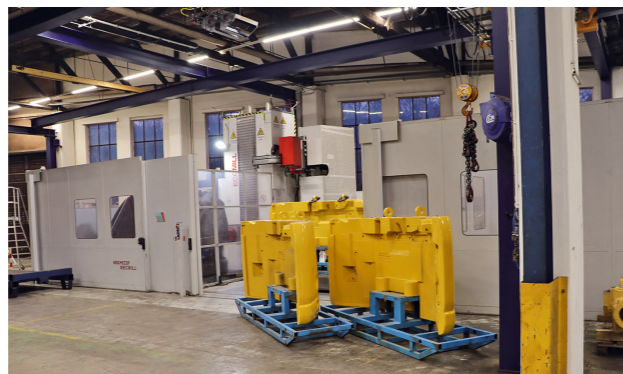
4 Seit März 2021 ist die Ecomill von Emco bei Komatsu Germany im Einsatz. Dank der hohen Flexibilität der Fahrständerfräsmaschine ersetzt diese Maschine zwei bisherige Bearbeitungszentren und ermöglicht eine Ein-Linien-Produktion